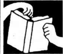
Gemeinsame Veranstaltung mit RL

Ort: Treffpunkt Hellersdorf, A.- Kuntz-Str. 62, 12627 Berlin